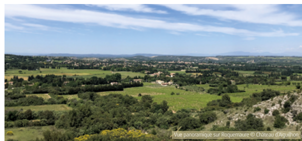
Vue panoramique sur Roquemaure