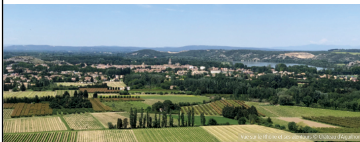
Vue sur le Rhône et ses alentours

4. Prendre à droite cette route. Traverser la route qui mène au domaine pour prendre, rapidement à droite, le sentier. Longer les vignes et retrouver le carrefour passé à l'aller.