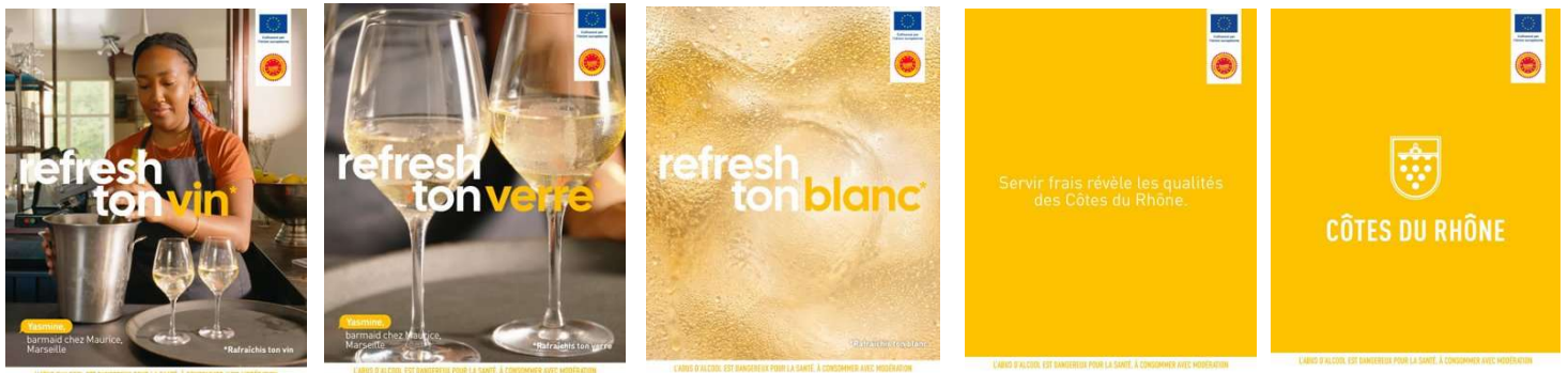
L'un des carrousels pour diffusion sur les réseaux sociaux

Avec la nouvelle signature « Refresh ton vin », l'appellation revendique ainsi une manière plus actuelle d'aborder le vin : sans protocole intimidant, sans expertise préalable, mais avec l'exigence de vins savoureux, identitaires et accessibles.